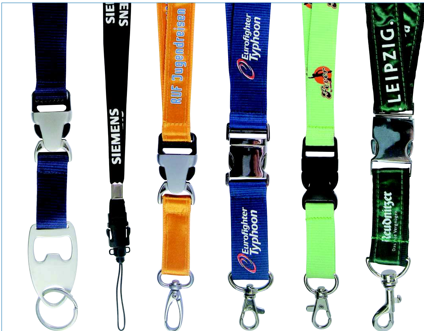
Designbeispiele verschiedene Lanyards und Schlüsselbänder (verkleinerte Abbildung)